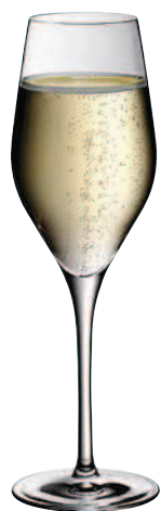
CHAMPAGNER 29 capacità 265 ml Altezza 223 mm Diametro 70 mm Conf. 6 pz. Art-Nr. 85 050 029 (neutro) 129 (0,1 l linea)