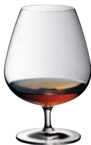
COGNAC 18 Capacità 610 ml Altezza 155 mm Diametro 104 mm Conf. 6 pz. Art.-Nr. 85 010 018 (neutro) 818 (2 cl + 4 cl linea )