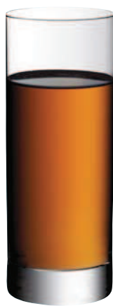
LONGDRINK 12 Capacità 405 ml Altezza 165 mm Diametro 66 mm Conf. 6 pz. Art.-Nr. 85 030 012 (neutro) 412 (0,3 l linea)