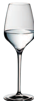
AMARI 23 Capacità 190 ml Altezza 200 mm Diametro 66 mm Conf. 6 Pz. Art-Nr. 85 050 023 (neutro) 823 (2 cl + 4 cl)