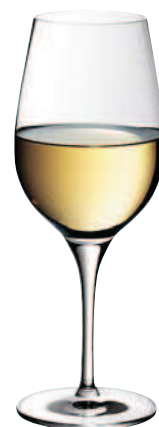
VINO BIANCO 02 Capacità 387 ml Altezza 210 mm Diametro 79 mm Conf. 6 pz. Art.-Nr. 85 020 002 (neutro) 102 (0,1 l linea) 202 (0,2 l linea)