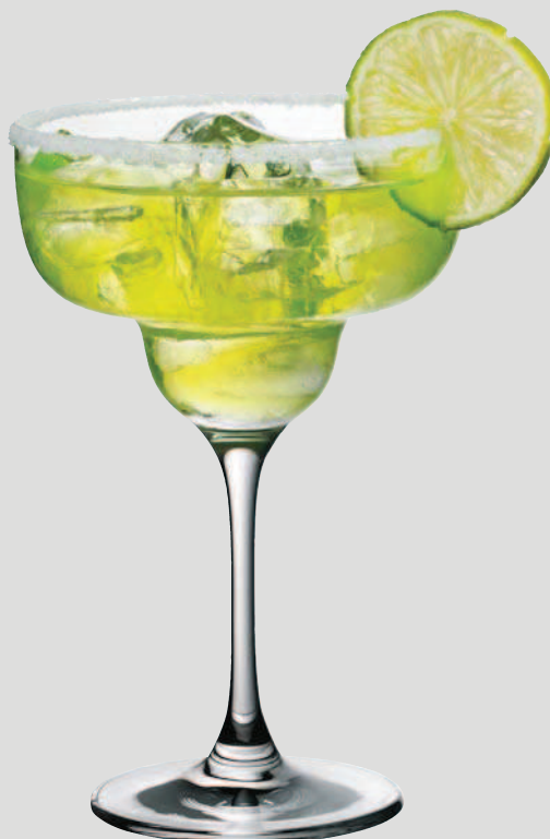
MARGARITA 97 Capacità 360 ml Altezza 175 mm Diametro 110 mm Conf. 6 pz. Art.-Nr. 85 030 097 (neutro)