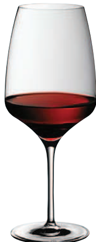
BORDEAUX 35 Capacità 645 ml Altezza 238 mm Diametro 95 mm Conf. 6 Pz. Art-Nr. 85 050 035 (neutro) 135 (0,1 l linea) 235 (0,2 l linea)