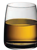
SOFTDRINK 14 Capacità 225 ml Altezza 92 mm Diametro 76 mm Conf. 6 pz. Art-Nr. 85 050 014 (neutro) 214 (0,2 l linea)