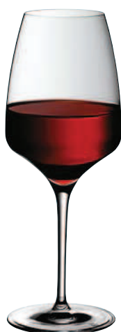
VINO ROSSO 01 Capacità 450 ml Altezza 225 mm Diametro 84 mm Conf. 6 Pz. Art-Nr. 85 050 001 (neutro) 101 (0,1 l linea) 201 (0,2 l linea)