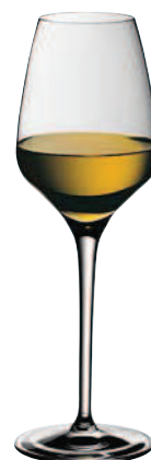
SHERRY/PORTO 04 Capacità 190 ml Altezza 200 mm Diametro 66 mm Conf. 6 Pz. Art-Nr. 85 050 004 (neutro) 504 (5 cl linea)