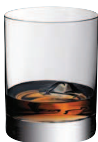
TUMBLER XL 16 Capacità 420 ml Altezza 106 mm Diametro 85 mm Conf. 6 pz. Art.-Nr. 85 030 016 (neutro)

Perfetto per tutti gli usi, in particolare per il whisky, "on the rocks", bevande, long drink, distillati e persino bevande analcoliche, bibite, succhi di frutta, acqua.