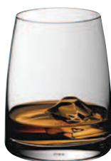
TUMBLER 15 Capacità 325 ml Altezza 102 mm Diametro 80 mm Conf. 6 pz. Art-Nr. 85 050 015 (neutro) 815 (2 cl+4 cl linea)