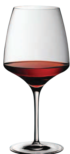
BURGUNDER 99 Capacità 695 ml Altezza 231 mm Diametro 105 mm Conf. 6 Pz. Art-Nr. 85 050 099 (neutro) 199 (0,1 l linea) 299 (0,2 l linea)