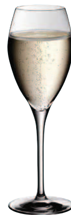
CHAMPAGNER 29 Capacità 210 ml Altezza 205 mm Diametro 68 mm Conf. 6 pz. Art.-Nr. 85 020 029 (neutro) 129 (0,1 l linea)