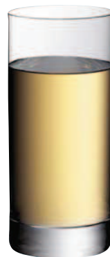
MIXDRINK 09 Capacità 350 ml Altezza 144 mm Diametro 65 mm Conf. 6 pz. Art.-Nr. 85 030 009 (neutro) 309 (0,25 l linea)