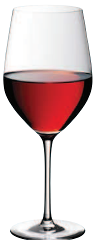
BORDEAUX 35 Capacità 635 ml Altezza 239 mm Diametro 95 mm Conf. 6 pz. Art.-Nr. 85 010 035 (neutro) 135 (0,1 l linea) 235 (0,2 l linea)