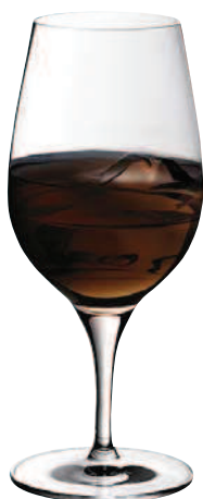
MINIBAR 10 Capacità 387 ml Altezza 175 mm Diametro 79 mm Conf. 6 pz. Art.-Nr. 85 020 010 (neutro) 210 (0,2 l linea)