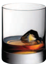
TUMBLER 15 Capacità 320 ml Altezza 94 mm Diametro 80 mm Conf. 6 pz. Art.-Nr. 85 030 015 (neutro) 815 (2 cl + 4 cl linea)