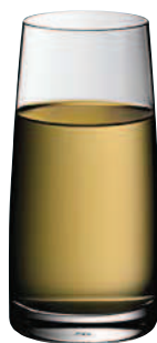
MIXDRINK 09 Capacità 361 ml Altezza 142 mm Diametro 68 mm Conf. 6 pz. Art-Nr. 85 050 009 (neutro) 309 (0,25 l linea)