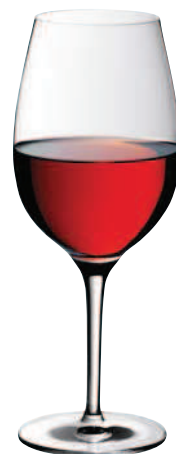
VINO ROSSO 01 Capacità 500 ml Altezza 219 mm Diametro 87 mm Conf. 6 pz. Art.-Nr. 85 020 001 (neutro) 101 (0,1 l linea) 201 (0,2 l linea)