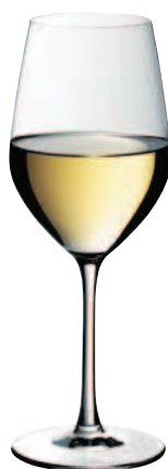
VINO BIANCO 02 Capacità 390 ml Altezza 212 mm Diametro 81 mm Conf. 6 pz. Art.-Nr. 85 010 002 (neutro) 102 (0,1 l linea) 202 (0,2 l linea)