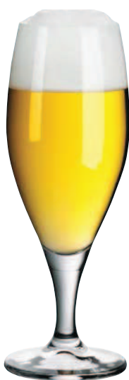
BIRRA TULIP 11 Capacità 380 ml Altezza 211 mm Diametro 75 mm Conf. 6 pz. Art.-Nr. 85 030 011 (neutro) 311 (0,3 l linea)