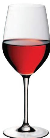
VINO ROSSO 01 Capacità 450 ml Altezza 224 mm Diametro 85 mm Conf. 6 pz. Art.-Nr. 85 010 001 (neutro) 101 (0,1 l linea) 201 (0,2 l linea)