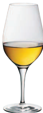
DEGUSTAZIONE 04 Capacità 290 ml Altezza 185 mm Diametro 73 mm Conf. 6 pz. Art.-Nr. 85 020 004 (neutro) 114 (0,1 l linea)