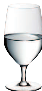
ACQUA 11 Capacità 410 ml Altezza 161 mm Diametro 81 mm Conf. 6 pz. Art.-Nr. 85 010 011 (neutro) 111 (0,1 l linea) 211 (0,2 l linea)