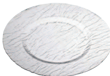
PIATTI VETRO * Altezza 20 mm Diametro 32 cm Conf. 1 pz. Art.-Nr. 85 095 002

* Articoli complementari richiedere disponibilità