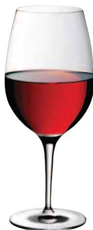
BORDEAUX 35 Capacità 650 ml Altezza 227 mm Diametro 95 mm Conf. 6 pz. Art.-Nr. 85 020 035 (neutro) 235 (0,2 l linea)

Il vetro è leggermente più spesso e decisamente più robusto di quelli di altri design convenzionali; eppure ogni calice è perfettamente bilanciato e si capisce di avere tra le mani un grande bicchiere. Una gamma snella, la nostra serie "Smart" che offre il bicchiere perfetto per ogni occasione e per l'uso quotidiano.