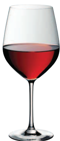
BURGUNDER 99 Capacità 705 ml Altezza 235 mm Diametro 102 mm Conf. 6 pz. Art.-Nr. 85 010 099 (neutro) 199 (0,1 l linea) 299 (0,2 l linea)