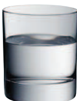
MINIBAR 47 Capacità 190 ml Altezza 80 mm Diametro 67 mm Conf. 6 pz. Art.-Nr. 85 030 047 (neutro)