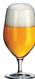
BIRRA 11 Capacità 410 ml Altezza 161 mm Diametro 81 mm Conf. 6 pz. Art.-Nr. 85 010 011 (neutro) 111 (0,1 l linea) 211 (0,2 l linea) Degustazione