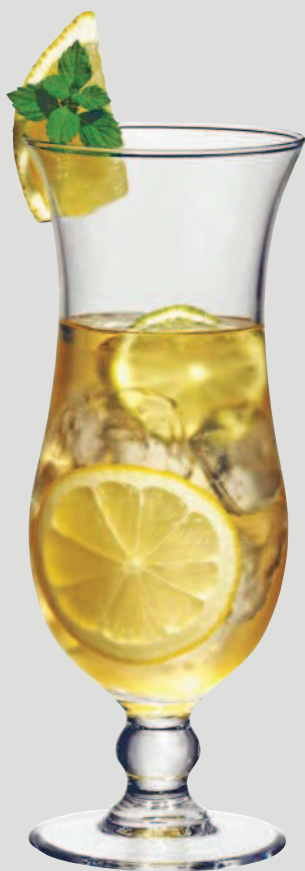
COCKTAIL 96 Capacità 440 ml Altezza 207 mm Diametro 80 mm Conf. 6 pz. Art.-Nr. 85 030 096 (neutro)