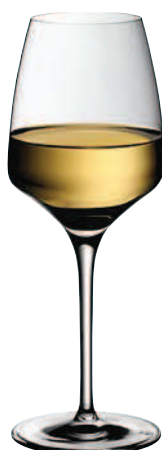
VINO BIANCO 02 Capacità 350 ml Altezza 214 mm Diametro 80 mm Conf. 6 Pz. Art-Nr. 85 050 002 (neutro) 102 (0,1 l linea) 202 (0,2 l linea)