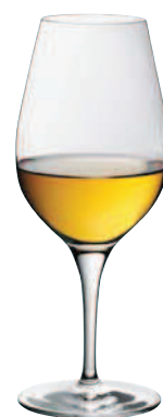
DEGUSTAZIONE 04 Capacità 290 ml Altezza 185 mm Diametro 73 mm Conf. 6 pz. Art.-Nr. 85 020 004 (neutro) 114 (0,1 l linea)