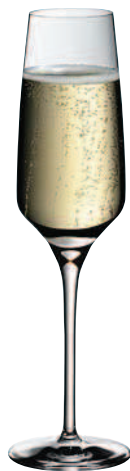
FLUTE 07 Capacità 188 ml Altezza 224 mm Diametro 63 mm Conf. 6 pz. Art-Nr. 85 050 007 (neutro) 107 (0,1 l linea)