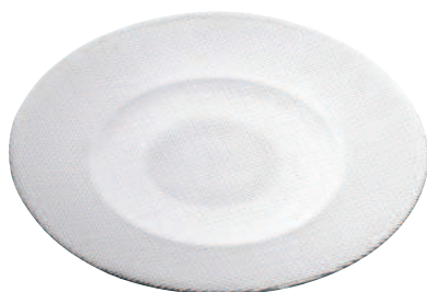
PIATTI VETRO * Altezza 20 mm Diametro 31 cm Conf. 1 pz. Art.-Nr. 85 095 001