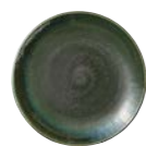
Teller flach rund coup 15 cm / Plate flat round coupe 15 cm Art-Nr: 8 01 1215 4 Durchmesser / diameter: 301 mm / 11.85" VPE: 6