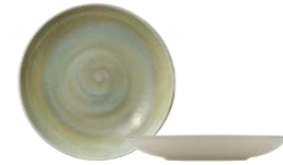
Teller tief rund coup 23 cm / Plate deep round coupe 23 cm Art-Nr: 8 01 1323 4 Durchmesser / diameter: 232 mm / 9.13" Inhalt / volume: 1,00 l / 33.81 fl. oz. VPE: 6