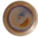
Teller flach rund coup 15 cm / Plate flat round coupe 15 cm Art-Nr: 8 01 1215 4 Durchmesser / diameter: 301 mm / 11.85" VPE: 6