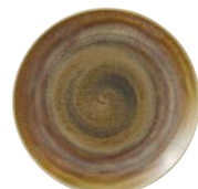
Teller flach rund coup 30 cm / Plate flat round coupe 30 cm Art-Nr: 8 01 1230 4 Durchmesser / diameter: 301 mm / 11.85" VPE: 6