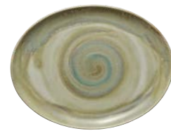
Platte oval coup 36x28 cm / Platter oval coupe 36x28 cm Art-Nr: 8 01 2236 4 Länge x Breite / length x width: 361 x 281 mm / 14.21" x 11.06" VPE: 6