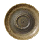
Untertasse rund 14 cm / Saucer round 14 cm Art-Nr: 8 01 6921 4 Durchmesser / diameter: 140 mm / 5.51" VPE: 6