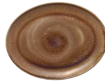
Platte oval coup 31x24 cm / Platter oval coupe 31x24 cm Art-Nr: 8 01 2231 4 Länge x Breite / length x width: 308 x 239 mm / 12.13" x 9.41" VPE: 6