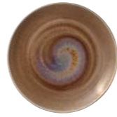
Teller flach rund coup 27 cm / Plate flat round coupe 27 cm Art-Nr: 8 01 1227 4 Durchmesser / diameter: 268 mm / 10.55" VPE: 6