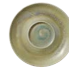
Untertasse rund 14 cm / Saucer round 14 cm Art-Nr: 8 01 6921 4 Durchmesser / diameter: 140 mm / 5.51" VPE: 6