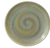
Teller flach rund coup 21 cm / Plate flat round coupe 21 cm Art-Nr: 8 01 1221 4 Durchmesser / diameter: 210 mm / 8.27" VPE: 6