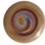
Teller flach rund coup 21 cm / Plate flat round coupe 21 cm Art-Nr: 8 01 1221 4 Durchmesser / diameter: 210 mm / 8.27" VPE: 6