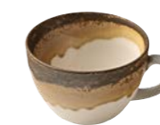
Obertasse 0.34 l / Cup 0.34 l Art-Nr: 8 01 5284 4 Durchmesser / diameter: 110 mm / 4.33" Inhalt / volume: 0,34 l / 11.50 fl. oz. VPE: 6