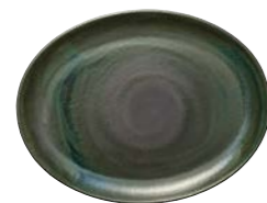
Platte oval coup 36x28 cm / Platter oval coupe 36x28 cm Art-Nr: 8 01 2236 4 Länge x Breite / length x width: 361 x 281 mm / 14.21" x 11.06" VPE: 6