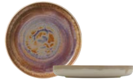
Teller tief rund hoher Rand 24 cm / Plate deep flat high rim 24 cm Art-Nr: 8 01 1924 4 Durchmesser / diameter: 242 mm / 9.53" Inhalt / volume: 1,40 l / 47.34 fl. oz. VPE: 6