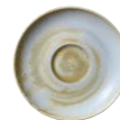
Untertasse rund 14 cm / Saucer round 14 cm Art-Nr: 8 01 6921 4 Durchmesser / diameter: 140 mm / 5.51" VPE: 6