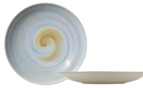
Teller tief rund coup 28 cm / Plate deep round coupe 28 cm Art-Nr: 8 01 1328 4 Durchmesser / diameter: 280 mm / 11.02" Inhalt / volume: 1,85 l / 62.56 fl. oz. VPE: 6