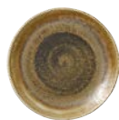
Teller flach rund coup 15 cm / Plate flat round coupe 15 cm Art-Nr: 8 01 1215 4 Durchmesser / diameter: 301 mm / 11.85" VPE: 6