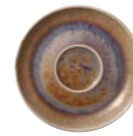
Untertasse rund 14 cm / Saucer round 14 cm Art-Nr: 8 01 6921 4 Durchmesser / diameter: 140 mm / 5.51" VPE: 6