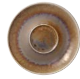
Untertasse rund 16 cm / Saucer round 16 cm Art-Nr: 8 01 6934 4 Durchmesser / diameter: 155 mm / 6.10" VPE: 6