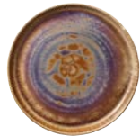
Teller flach rund hoher Rand 21 cm / Plate round flat high rim 21 cm Art-Nr: 8 01 1821 4 Durchmesser / diameter: 214 mm / 8.43" Inhalt / volume: 0,40 l / 13.53 fl. oz. VPE: 6