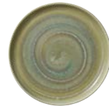
Teller flach rund hoher Rand 21 cm / Plate round flat high rim 21 cm Art-Nr: 8 01 1821 4 Durchmesser / diameter: 214 mm / 8.43" Inhalt / volume: 0,40 l / 13.53 fl. oz. VPE: 6