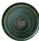
Teller flach rund hoher Rand 27 cm / Plate round flat high rim 27 cm Art-Nr: 8 01 1827 4 Durchmesser / diameter: 267 mm / 10.51" Inhalt / volume: 0,60 l / 20.29 fl. oz. VPE: 6