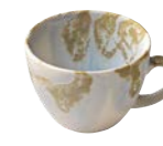
Obertasse 0.21 l / Cup 0.21 l Art-Nr: 8 01 5271 4 Durchmesser / diameter: 90 mm / 3.54" Inhalt / volume: 0,21 l / 7.10 fl. oz. VPE: 6