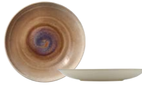
Teller tief rund coup 28 cm / Plate deep round coupe 28 cm Art-Nr: 8 01 1328 4 Durchmesser / diameter: 280 mm / 11.02" Inhalt / volume: 1,85 l / 62.56 fl. oz. VPE: 6