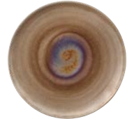
Teller flach rund coup 30 cm / Plate flat round coupe 30 cm Art-Nr: 8 01 1230 4 Durchmesser / diameter: 301 mm / 11.85" VPE: 6