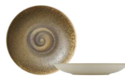
Teller tief rund coup 23 cm / Plate deep round coupe 23 cm Art-Nr: 8 01 1323 4 Durchmesser / diameter: 232 mm / 9.13" Inhalt / volume: 1,00 l / 33.81 fl. oz. VPE: 6