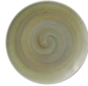
Teller flach rund coup 30 cm / Plate flat round coupe 30 cm Art-Nr: 8 01 1230 4 Durchmesser / diameter: 301 mm / 11.85" VPE: 6