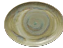
Platte oval coup 31x24 cm / Platter oval coupe 31x24 cm Art-Nr: 8 01 2231 4 Länge x Breite / length x width: 308 x 239 mm / 12.13" x 9.41" VPE: 6