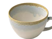
Obertasse 0.34 l / Cup 0.34 l Art-Nr: 8 01 5284 4 Durchmesser / diameter: 110 mm / 4.33" Inhalt / volume: 0,34 l / 11.50 fl. oz. VPE: 6