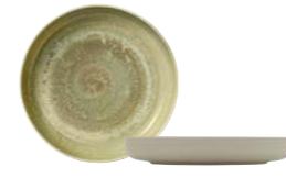
Teller tief rund hoher Rand 21 cm / Plate deep flat high rim 21 cm Art-Nr: 8 01 1921 4 Durchmesser / diameter: 203 mm / 7.99" Inhalt / volume: 1,00 l / 33.81 fl. oz. VPE: 6