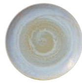
Teller flach rund coup 27 cm / Plate flat round coupe 27 cm Art-Nr: 8 01 1227 4 Durchmesser / diameter: 268 mm / 10.55" VPE: 6