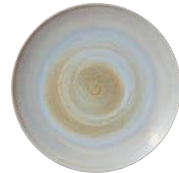
Teller flach rund coup 30 cm / Plate flat round coupe 30 cm Art-Nr: 8 01 1230 4 Durchmesser / diameter: 301 mm / 11.85" VPE: 6