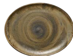
Platte oval coup 36x28 cm / Platter oval coupe 36x28 cm Art-Nr: 8 01 2236 4 Länge x Breite / length x width: 361 x 281 mm / 14.21" x 11.06" VPE: 6