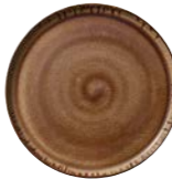
Teller flach rund hoher Rand 27 cm / Plate round flat high rim 27 cm Art-Nr: 8 01 1827 4 Durchmesser / diameter: 267 mm / 10.51" Inhalt / volume: 0,60 l / 20.29 fl. oz. VPE: 6