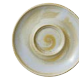
Untertasse rund 16 cm / Saucer round 16 cm Art-Nr: 8 01 6934 4 Durchmesser / diameter: 155 mm / 6.10" VPE: 6