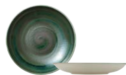
Teller tief rund coup 23 cm / Plate deep round coupe 23 cm Art-Nr: 8 01 1323 4 Durchmesser / diameter: 232 mm / 9.13" Inhalt / volume: 1,00 l / 33.81 fl. oz. VPE: 6