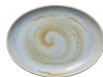
Platte oval coup 25x19 cm / Platter oval coupe 25x19 cm Art-Nr: 8 01 2225 4 Länge x Breite / length x width: 253 x 189 mm / 9.96" x 7.44" VPE: 6