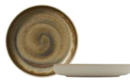
Teller tief rund hoher Rand 21 cm / Plate deep flat high rim 21 cm Art-Nr: 8 01 1921 4 Durchmesser / diameter: 203 mm / 7.99" Inhalt / volume: 1,00 l / 33.81 fl. oz. VPE: 6