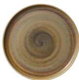
Teller flach rund hoher Rand 27 cm / Plate round flat high rim 27 cm Art-Nr: 8 01 1827 4 Durchmesser / diameter: 267 mm / 10.51" Inhalt / volume: 0,60 l / 20.29 fl. oz. VPE: 6