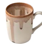
Becher 0.25 l / Mug 0.25 l Art-Nr: 8 01 5625 4 Durchmesser / diameter: 75 mm / 2.95" Inhalt / volume: 0,25 l / 8.45 fl. oz. VPE: 6

Abgabe nur in Verpackungseinheit (VPE) Delivery only by packaging unit (PU)