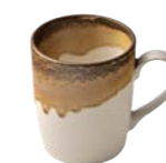
Becher 0.25 l / Mug 0.25 l Art-Nr: 8 01 5625 4 Durchmesser / diameter: 75 mm / 2.95" Inhalt / volume: 0,25 l / 8.45 fl. oz. VPE: 6

Abgabe nur in Verpackungseinheit (VPE) Delivery only by packaging unit (PU)