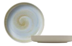
Teller tief rund hoher Rand 21 cm / Plate deep flat high rim 21 cm Art-Nr: 8 01 1921 4 Durchmesser / diameter: 203 mm / 7.99" Inhalt / volume: 1,00 l / 33.81 fl. oz. VPE: 6