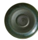
Untertasse rund 14 cm / Saucer round 14 cm Art-Nr: 8 01 6921 4 Durchmesser / diameter: 140 mm / 5.51" VPE: 6