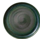
Teller flach rund hoher Rand 21 cm / Plate round flat high rim 21 cm Art-Nr: 8 01 1821 4 Durchmesser / diameter: 214 mm / 8.43" Inhalt / volume: 0,40 l / 13.53 fl. oz. VPE: 6