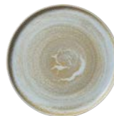
Teller flach rund hoher Rand 27 cm / Plate round flat high rim 27 cm Art-Nr: 8 01 1827 4 Durchmesser / diameter: 267 mm / 10.51" Inhalt / volume: 0,60 l / 20.29 fl. oz. VPE: 6