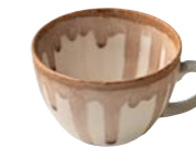
Obertasse 0.34 l / Cup 0.34 l Art-Nr: 8 01 5284 4 Durchmesser / diameter: 110 mm / 4.33" Inhalt / volume: 0,34 l / 11.50 fl. oz. VPE: 6