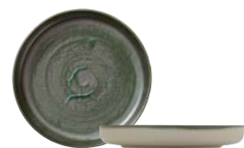
Teller tief rund hoher Rand 24 cm / Plate deep flat high rim 24 cm Art-Nr: 8 01 1924 4 Durchmesser / diameter: 242 mm / 9.53" Inhalt / volume: 1,40 l / 47.34 fl. oz. VPE: 6