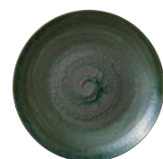
Teller flach rund coup 30 cm / Plate flat round coupe 30 cm Art-Nr: 8 01 1230 4 Durchmesser / diameter: 301 mm / 11.85" VPE: 6