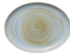
Platte oval coup 36x28 cm / Platter oval coupe 36x28 cm Art-Nr: 8 01 2236 4 Länge x Breite / length x width: 361 x 281 mm / 14.21" x 11.06" VPE: 6