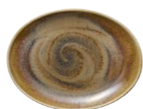
Platte oval coup 25x19 cm / Platter oval coupe 25x19 cm Art-Nr: 8 01 2225 4 Länge x Breite / length x width: 253 x 189 mm / 9.96" x 7.44" VPE: 6