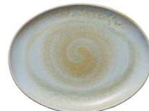
Platte oval coup 31x24 cm / Platter oval coupe 31x24 cm Art-Nr: 8 01 2231 4 Länge x Breite / length x width: 308 x 239 mm / 12.13" x 9.41" VPE: 6