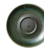
Untertasse rund 16 cm / Saucer round 16 cm Art-Nr: 8 01 6934 4 Durchmesser / diameter: 155 mm / 6.10" VPE: 6