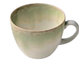
Obertasse 0.21 l / Cup 0.21 l Art-Nr: 8 01 5271 4 Durchmesser / diameter: 90 mm / 3.54" Inhalt / volume: 0,21 l / 7.10 fl. oz. VPE: 6