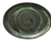
Platte oval coup 31x24 cm / Platter oval coupe 31x24 cm Art-Nr: 8 01 2231 4 Länge x Breite / length x width: 308 x 239 mm / 12.13" x 9.41" VPE: 6