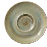
Untertasse rund 16 cm / Saucer round 16 cm Art-Nr: 8 01 6934 4 Durchmesser / diameter: 155 mm / 6.10" VPE: 6