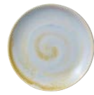
Teller flach rund coup 15 cm / Plate flat round coupe 15 cm Art-Nr: 8 01 1215 4 Durchmesser / diameter: 301 mm / 11.85" VPE: 6