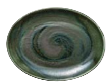
Platte oval coup 25x19 cm / Platter oval coupe 25x19 cm Art-Nr: 8 01 2225 4 Länge x Breite / length x width: 253 x 189 mm / 9.96" x 7.44" VPE: 6