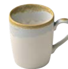
Becher 0.25 l / Mug 0.25 l Art-Nr: 8 01 5625 4 Durchmesser / diameter: 75 mm / 2.95" Inhalt / volume: 0,25 l / 8.45 fl. oz. VPE: 6

Abgabe nur in Verpackungseinheit (VPE) Delivery only by packaging unit (PU)