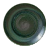
Teller flach rund coup 21 cm / Plate flat round coupe 21 cm Art-Nr: 8 01 1221 4 Durchmesser / diameter: 210 mm / 8.27" VPE: 6