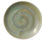
Teller flach rund coup 15 cm / Plate flat round coupe 15 cm Art-Nr: 8 01 1215 4 Durchmesser / diameter: 301 mm / 11.85" VPE: 6