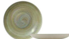
Teller tief rund coup 28 cm / Plate deep round coupe 28 cm Art-Nr: 8 01 1328 4 Durchmesser / diameter: 280 mm / 11.02" Inhalt / volume: 1,85 l / 62.56 fl. oz. VPE: 6