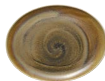
Platte oval coup 31x24 cm / Platter oval coupe 31x24 cm Art-Nr: 8 01 2231 4 Länge x Breite / length x width: 308 x 239 mm / 12.13" x 9.41" VPE: 6