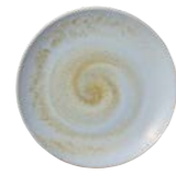
Teller flach rund coup 21 cm / Plate flat round coupe 21 cm Art-Nr: 8 01 1221 4 Durchmesser / diameter: 210 mm / 8.27" VPE: 6