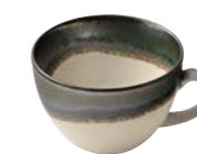
Obertasse 0.34 l / Cup 0.34 l Art-Nr: 8 01 5284 4 Durchmesser / diameter: 110 mm / 4.33" Inhalt / volume: 0,34 l / 11.50 fl. oz. VPE: 6