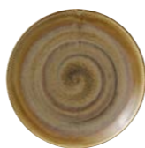
Teller flach rund coup 27 cm / Plate flat round coupe 27 cm Art-Nr: 8 01 1227 4 Durchmesser / diameter: 268 mm / 10.55" VPE: 6