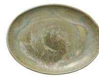
Platte oval coup 25x19 cm / Platter oval coupe 25x19 cm Art-Nr: 8 01 2225 4 Länge x Breite / length x width: 253 x 189 mm / 9.96" x 7.44" VPE: 6