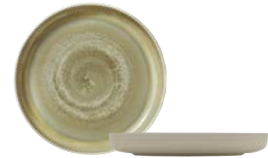
Teller tief rund hoher Rand 24 cm / Plate deep flat high rim 24 cm Art-Nr: 8 01 1924 4 Durchmesser / diameter: 242 mm / 9.53" Inhalt / volume: 1,40 l / 47.34 fl. oz. VPE: 6