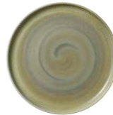
Teller flach rund hoher Rand 27 cm / Plate round flat high rim 27 cm Art-Nr: 8 01 1827 4 Durchmesser / diameter: 267 mm / 10.51" Inhalt / volume: 0,60 l / 20.29 fl. oz. VPE: 6