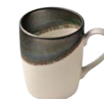
Becher 0.25 l / Mug 0.25 l Art-Nr: 8 01 5625 4 Durchmesser / diameter: 75 mm / 2.95" Inhalt / volume: 0,25 l / 8.45 fl. oz. VPE: 6

Abgabe nur in Verpackungseinheit (VPE) Delivery only by packaging unit (PU)