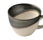
Obertasse 0.21 l / Cup 0.21 l Art-Nr: 8 01 5271 4 Durchmesser / diameter: 90 mm / 3.54" Inhalt / volume: 0,21 l / 7.10 fl. oz. VPE: 6