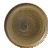
Teller flach rund hoher Rand 21 cm / Plate round flat high rim 21 cm Art-Nr: 8 01 1821 4 Durchmesser / diameter: 214 mm / 8.43" Inhalt / volume: 0,40 l / 13.53 fl. oz. VPE: 6