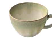
Obertasse 0.34 l / Cup 0.34 l Art-Nr: 8 01 5284 4 Durchmesser / diameter: 110 mm / 4.33" Inhalt / volume: 0,34 l / 11.50 fl. oz. VPE: 6