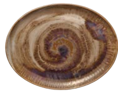
Platte oval coup 36x28 cm / Platter oval coupe 36x28 cm Art-Nr: 8 01 2236 4 Länge x Breite / length x width: 361 x 281 mm / 14.21" x 11.06" VPE: 6