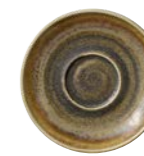
Untertasse rund 16 cm / Saucer round 16 cm Art-Nr: 8 01 6934 4 Durchmesser / diameter: 155 mm / 6.10" VPE: 6