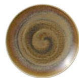
Teller flach rund coup 21 cm / Plate flat round coupe 21 cm Art-Nr: 8 01 1221 4 Durchmesser / diameter: 210 mm / 8.27" VPE: 6