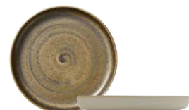
Teller tief rund hoher Rand 24 cm / Plate deep flat high rim 24 cm Art-Nr: 8 01 1924 4 Durchmesser / diameter: 242 mm / 9.53" Inhalt / volume: 1,40 l / 47.34 fl. oz. VPE: 6