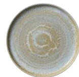
Teller flach rund hoher Rand 21 cm / Plate round flat high rim 21 cm Art-Nr: 8 01 1821 4 Durchmesser / diameter: 214 mm / 8.43" Inhalt / volume: 0,40 l / 13.53 fl. oz. VPE: 6