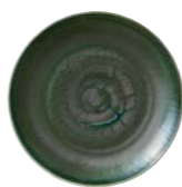
Teller flach rund coup 27 cm / Plate flat round coupe 27 cm Art-Nr: 8 01 1227 4 Durchmesser / diameter: 268 mm / 10.55" VPE: 6