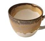
Obertasse 0.21 l / Cup 0.21 l Art-Nr: 8 01 5271 4 Durchmesser / diameter: 90 mm / 3.54" Inhalt / volume: 0,21 l / 7.10 fl. oz. VPE: 6