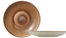
Teller tief rund coup 23 cm / Plate deep round coupe 23 cm Art-Nr: 8 01 1323 4 Durchmesser / diameter: 232 mm / 9.13" Inhalt / volume: 1,00 l / 33.81 fl. oz. VPE: 6