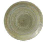
Teller flach rund coup 27 cm / Plate flat round coupe 27 cm Art-Nr: 8 01 1227 4 Durchmesser / diameter: 268 mm / 10.55" VPE: 6