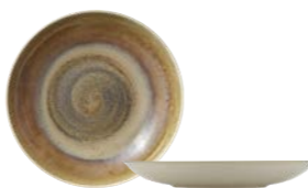
Teller tief rund coup 28 cm / Plate deep round coupe 28 cm Art-Nr: 8 01 1328 4 Durchmesser / diameter: 280 mm / 11.02" Inhalt / volume: 1,85 l / 62.56 fl. oz. VPE: 6