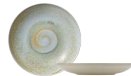
Teller tief rund coup 23 cm / Plate deep round coupe 23 cm Art-Nr: 8 01 1323 4 Durchmesser / diameter: 232 mm / 9.13" Inhalt / volume: 1,00 l / 33.81 fl. oz. VPE: 6