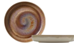
Teller tief rund hoher Rand 21 cm / Plate deep flat high rim 21 cm Art-Nr: 8 01 1921 4 Durchmesser / diameter: 203 mm / 7.99" Inhalt / volume: 1,00 l / 33.81 fl. oz. VPE: 6