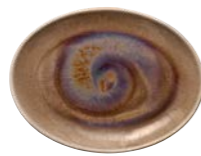
Platte oval coup 25x19 cm / Platter oval coupe 25x19 cm Art-Nr: 8 01 2225 4 Länge x Breite / length x width: 253 x 189 mm / 9.96" x 7.44" VPE: 6