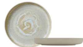
Teller tief rund hoher Rand 24 cm / Plate deep flat high rim 24 cm Art-Nr: 8 01 1924 4 Durchmesser / diameter: 242 mm / 9.53" Inhalt / volume: 1,40 l / 47.34 fl. oz. VPE: 6