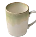
Becher 0.25 l / Mug 0.25 l Art-Nr: 8 01 5625 4 Durchmesser / diameter: 75 mm / 2.95" Inhalt / volume: 0,25 l / 8.45 fl. oz. VPE: 6

Abgabe nur in Verpackungseinheit (VPE) Delivery only by packaging unit (PU)