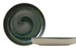
Teller tief rund hoher Rand 21 cm / Plate deep flat high rim 21 cm Art-Nr: 8 01 1921 4 Durchmesser / diameter: 203 mm / 7.99" Inhalt / volume: 1,00 l / 33.81 fl. oz. VPE: 6